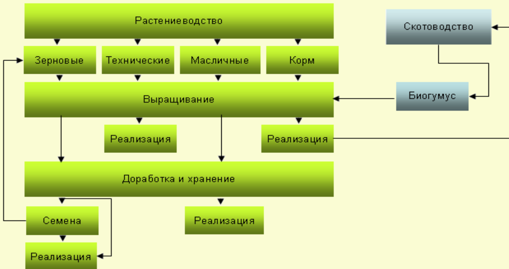
Схема производственных связей